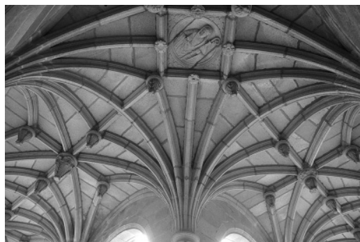
Figura 5 Bóvedas del claustro del Monasterio de Poio.

Las bóvedas de la nave central de la iglesia del Monasterio de Canedo presentan una solución singular. Convento franciscano construido sobre un palacio previo del que se aprovechó, poco más que la piedra, se ejecutó la iglesia en el s. XVIII –en dos de sus arcos se leen los años de 1775 y de 1777–. Aquí la plementería está formada por perpiaños dispuestos sobre los nervios ojivos de la bóveda como si se tratase de una bóveda de cañón con lunetos, solución propiciada quizás por lo tardío de su construcción.