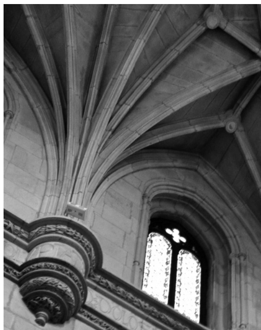
Figura 3 Detalle del cimborrio del Hospital Real de Santiago de Compostela

En algunos casos, el nacimiento de los nervios se produce a partir de un cilindro resaltado que sustituye al enjarje. A falta de datos documentales, esta solución podría haberse debido en algunos casos a las dificultades de materialización de un elemento en concreto o tal vez a las dificultades económicas, pero