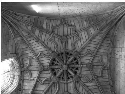
Figura 4 Bóveda del Panteón Real de la Catedral de Santiago de Compostela

mentería se labra imitando el juego de rehundidos de una bóveda continua clasicista. A veces la plementería sirve incluso de soporte a elementos escultóricos, como en las bóvedas de los rincones del claustro del Monasterio de Poio, [K.6] (figura 5), bóvedas de ojivos interrumpidos cuyos plementos centrales son esculpidos formando un bajorrelieve –coloreado en unos casos y no en otros–, y, especialmente, en la plateresca Capilla de Alba de la Iglesia de Santiago de Puebla del Deán [K.7], cuyos elementos de la zona central soportan imágenes de bulto y una clave que es una escultura pinjante. En otros casos se da el conocido reaprovechamiento de piezas, como en la llamada bóveda de las lápidas del Monasterio de Oseira, cuya plementería está formada por losas sepulcrales en las cuales son perfectamente visibles las laudas funerarias.