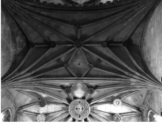
Figura 2 Capilla Mayor de la iglesia de Santa María la Mayor de Pontevedra

caso opuesto se da en la Capilla Mayor de la iglesia de Santa María la Mayor de Pontevedra (figura 2), en la que el arco fajón reduce su sección al aproximarse al jarjamento para igualarla a la del resto de los nervios de la bóveda.