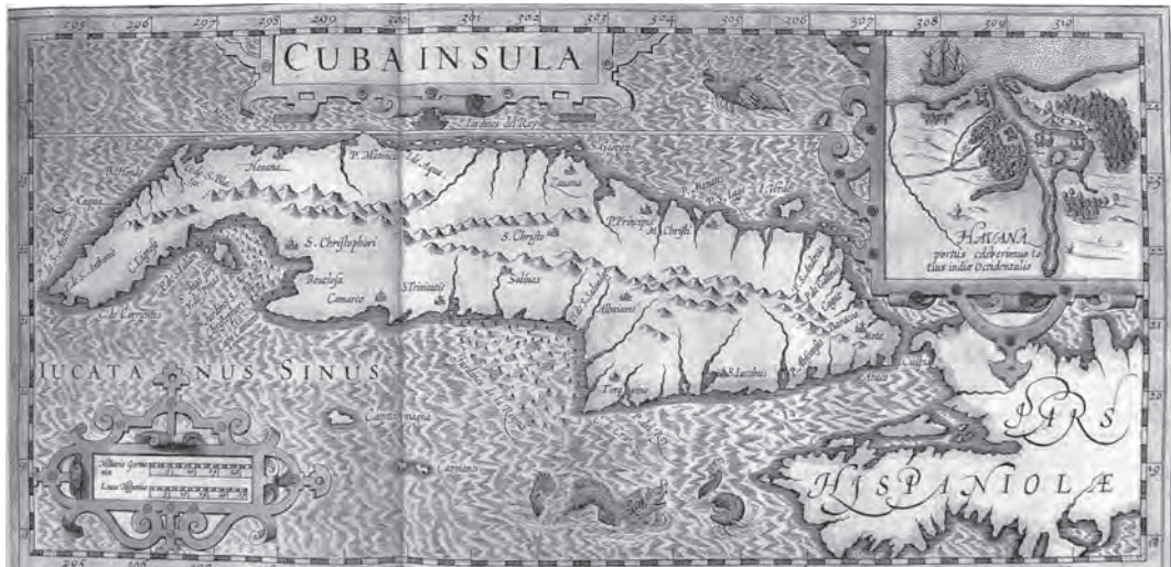
Figura 3 Cuba Insula, mapa de Gerardo Mercator de 1639 donde aparecen las primeras villas fundadas por España (tomado de History of America , de Justin Winsor).

En las primeras villas fundadas durante el siglo XVI, en los inicios del período colonial, se crearon, a partir de sus sitios fundacionales, las primeras estructuras físicas: el trazado urbano, la incipiente plaza con las primitivas edificaciones representativas el poder colonial, la autoridad local y la iglesia, y las precarias casas de los primeros vecinos. Muchas veces se escogieron para fundar estas poblaciones la cercanía a los asentamientos aborígenes que estaban situados cerca de los ríos para abastecerse de agua y obtener otras ventajas que ofrecía el medio