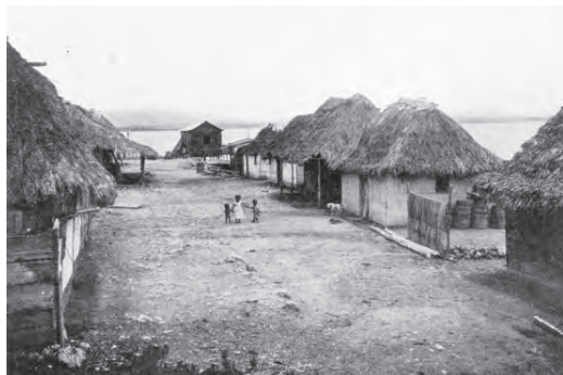
Figura 4 Caserío de Boca de Camarioca en la provincia de Matanzas

El proceso de fundación de poblaciones se ve frenado a partir de la segunda década del siglo XVI período en que la isla sufrió una considerable pérdida de su población de españoles durante la conquista y establecimiento de los grandes virreinos de México y Perú. El informe de su visita pastoral realizada en 1543 por el obispo fray Diego Sarmiento y Castilla recogió la población de españoles residentes en seis de las villas con los siguientes resultados: en Bayamo treinta, Puer-