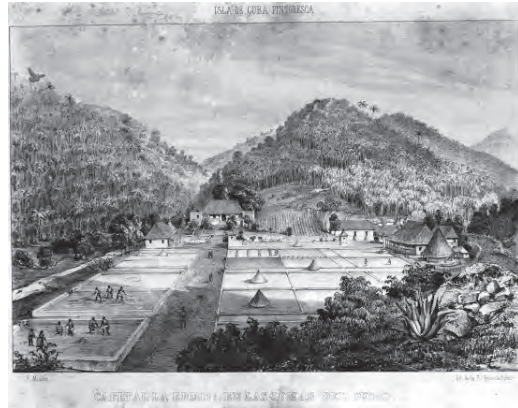
Figura 8 Grabado que reproduce los secaderos de café del cafetal La Ermita en el Cusco (tomado de Isla de Cuba Pintoesca , 1841)

A fines del siglo XVIII, la sublevación de los esclavos en la colonia francesa de Haití que produjo la