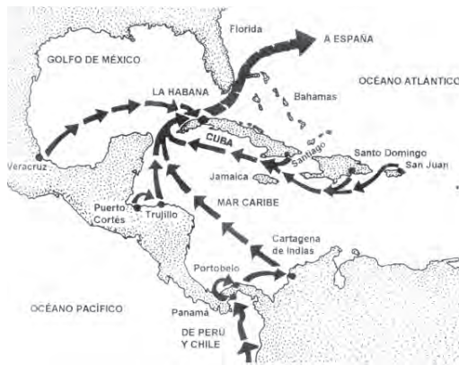
Figura 5 Rutas del sistema de flotas entre el Nuevo Mundo y España (Tomado de La Habana, ciudad colonial de José Manuel Fernández Núñez).

Los habaneros mantenían con las flotas otra forma particular de comercio. Vendíanles frutas, carne, pes-