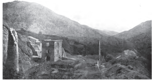
Figura 2 Ruinas de las minas de cobre en Santiago de Cuba, imagen de 1897

De los ocho primeros sitios fundacionales seis estuvieron localizados en la costa o cerca de ella. Solo Bayamo y Sancti Spiritus se ubicaron «tierra adentro» y en 1528 lo sería Santa María de Puerto Príncipe cuando se trasladó desde un sitio costero hacia el centro del territorio, por ello es muy probable que utilizaran los mismos senderos que los aborígenes para llegar a la costa.