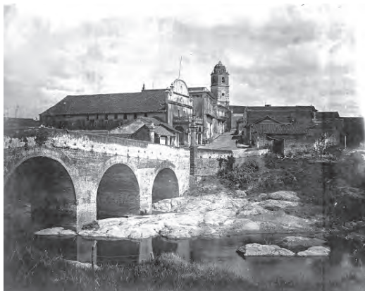
Figura 1 El puente del río Yayabo en la villa de Sancti Spiritus, imagen de fines del siglo XIX

de los siglos coloniales, así como una variada información acerca de esas localidades. Para cada asentamiento se ha elaborado una reseña sintética que contiene la información sobre las características de su localización geográfica, las motivaciones que originaron su fundación, las características físicas de su trazado, las construcciones más significativas por sus rasgos distintivos arquitectónicos, la influencia de la actividad económica en su desarrollo y los vínculos territoriales a través de las vías de comunicación.