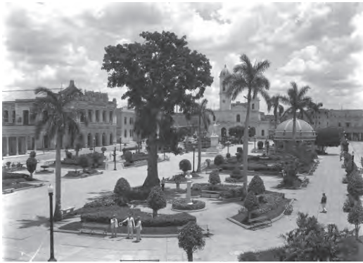
Figura 10 Plaza Central de Cienfuegos y su entorno arquitectónico neoclásico.

el siglo XIX. Los asentamientos fundados por conveniencia de la administración colonial cuando tuvieron una base económica que los sustentara, tendieron a desaparecer.