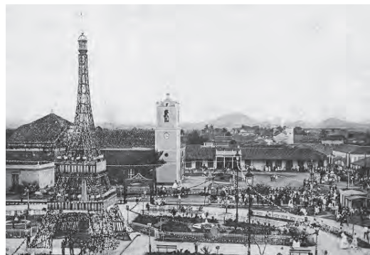
Figura 12 Plaza principal de Santa Clara en la inauguración del servicio eléctrico 1898

El papel que tuvieron la actividad económica y las ordenanzas para la construcción fueron determinantes en el proceso histórico de urbanización del territorio y en la configuración del entorno físico de los asentamientos poblacionales del país. Las construcciones han sido su expresión material más perdurable, por ello constituyen un componente esencial del patrimonio de la nación cubana y de su memoria his-