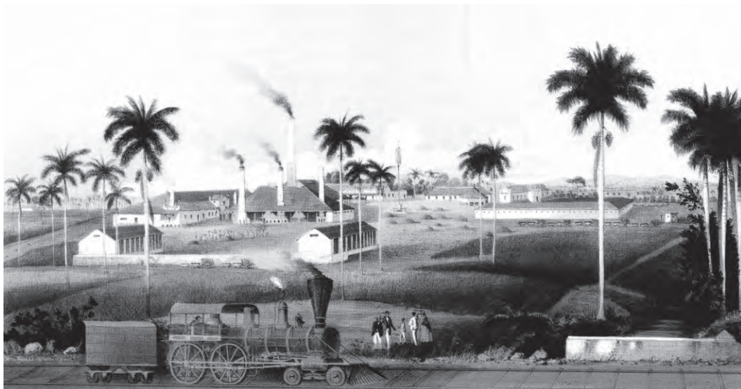
Figura 9 Grabado del siglo XIX que muestra una imagen ingenio azucarero Ácana.

En las poblaciones que recibían el título de ciudad la cantidad y calidad de las construcciones, los materiales de construcción que empleaban así como su diversidad, denotan la importancia económica de un asentamiento. Un ejemplo de esto es la villa de Matanzas en 1860 tenía 4 326 viviendas y de ellas más del 50 por ciento eran de mampostería, y además había hoteles, teatros, cuartel de bomberos y varios puentes de superior calidad, nos está demostrando la riqueza de aquella población. Otras ciudades tuvieron un mayor desarrollo por el embarque del azúcar, la concentración de ingenios y otros factores económicos, tales como Cárdenas, Sagua la Grande Cienfuegos, exponentes del neoclásico cubano que fueron fundadas en