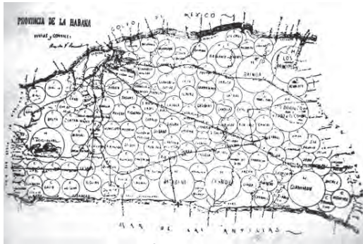
Figura 7 Mapa de los hatos y corrales de la región de la Habana en el siglo XIX

de la costa y alejados de los puertos; entonces construían un pequeño muelle para embarcar sus productos. Los embarcaderos se establecieron en lugares propicios de la costa y los asentamientos que surgieron junto a ellos en algunos casos llegarían a constituirse en poblados. Durante el siglo XVII, a los lugares ya utilizados como puertos y embarcaderos se incorporan Surgidero de Batabanó al sur de La Habana, muy conveniente para la comunicación con Trinidad, Santiago de Cuba y La Guanaja en la costa al norte de Puerto Príncipe que les servía para comunicarse con La Habana y San Juan de los Remedios.