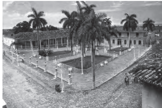
Figura 11 Plaza Mayor de Trinidad en los fines del siglo XIX, daguerrotipo.

En 1574 se promulgaron las primeras «Ordenanzas Municipales para la Villa de La Habana y demás villas y lugares de la Isla de Cuba», redactadas por Alonso de Cáceres. Fueron aprobadas por el cabildo en 1574 y puestas en vigor oficialmente en 1640, si